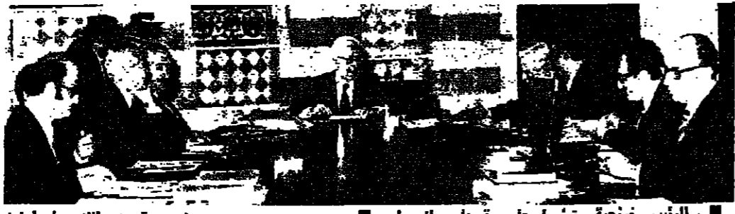
الرئيس ترونيّة ترؤس جلسة مجلس الوزراء

اعتقد مجلس الوزراء أمس لثلاث ساعات كاملة، دون أن يخرج بيعة ترارات، وتقل من الجلسة أنها كانت تقيماً شاملاً للوضع، في ضوء التطورات الداخلية والخارجية والأمنية، والتي أصبحت تهمس بالمعلومات عن أجواء هذه المناقشات، وتؤكد هذه المعلومات أن هناك تضافراً بين المراجع العليا ورئيس الحكومة استعراض جميع القضايا المحروسة على الصعيد السياسي، وبمناقشة بروج افتتاح حوار.